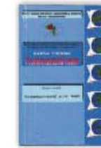
8. Геоэкономический атлас мира, Москва, 2002.